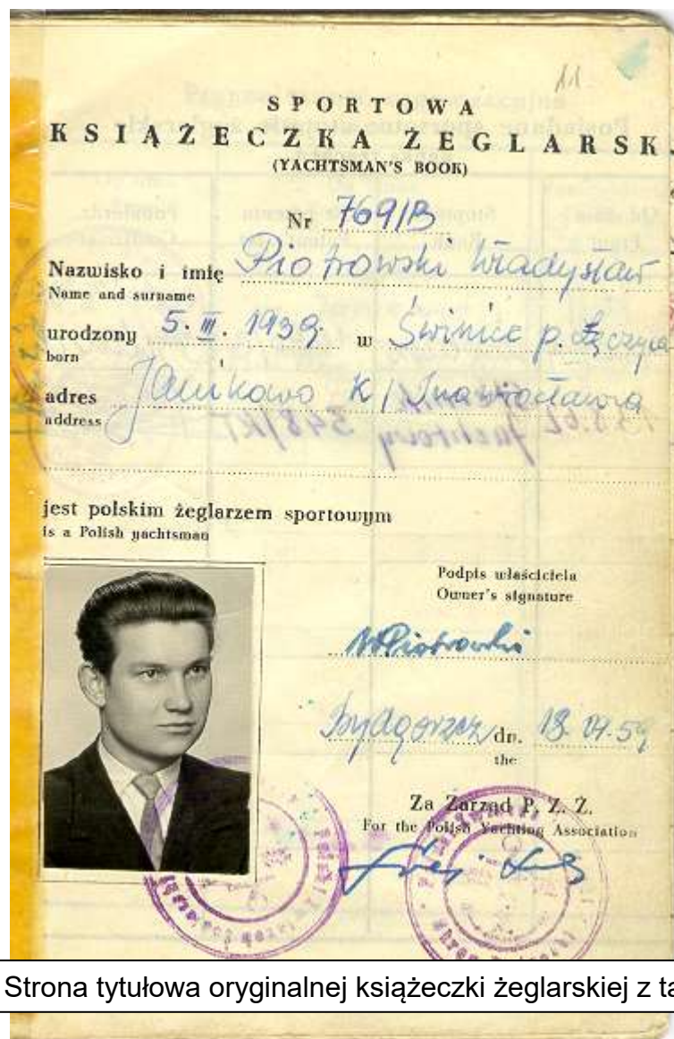
Strona tytułowa oryginalnej książeczki żeglarskiej z tamtych lat